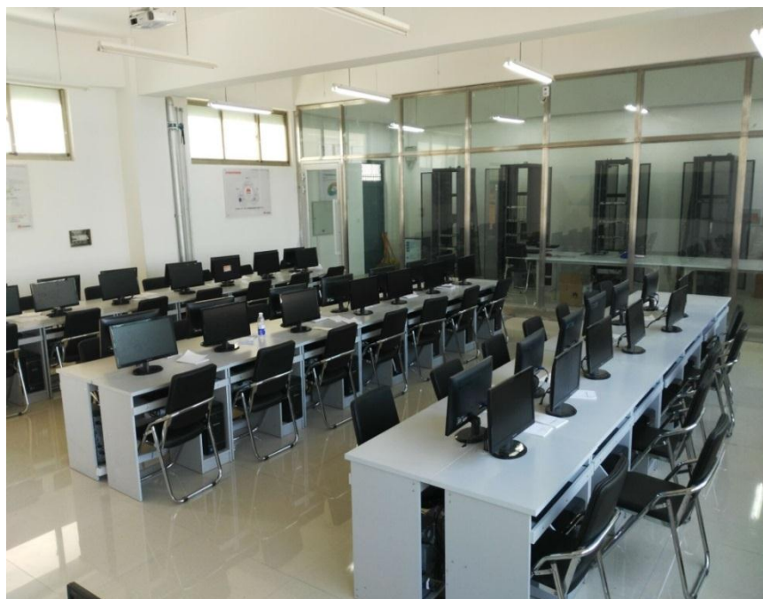
图 7-2 数据通信实训室

该实训室主要用于云服务器硬件安装、云操作系统安装、云终端硬件安装、云终端软件安装、云存储配置、虚拟机景象制作、虚拟机的创建和发放等实验实训。