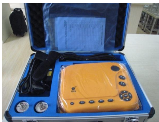
钢筋位置测定仪 KON-RBL (D)