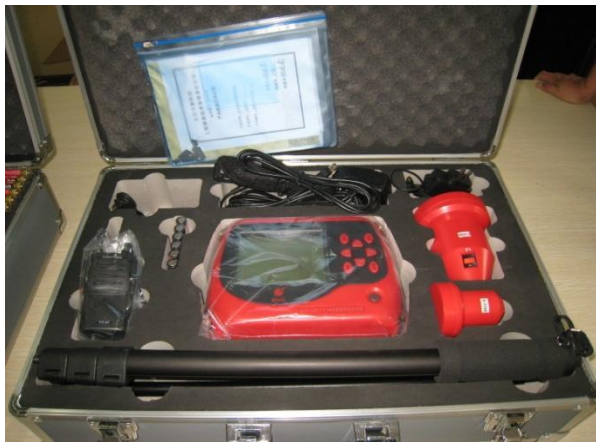
非金属板厚度测测试仪 KON-LBY (B)