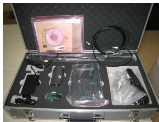
非金属超声检测分析仪 NM-4B