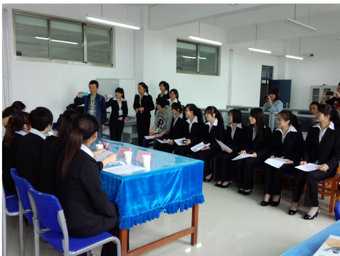
文秘学生在文秘综合实训室进行办会实训