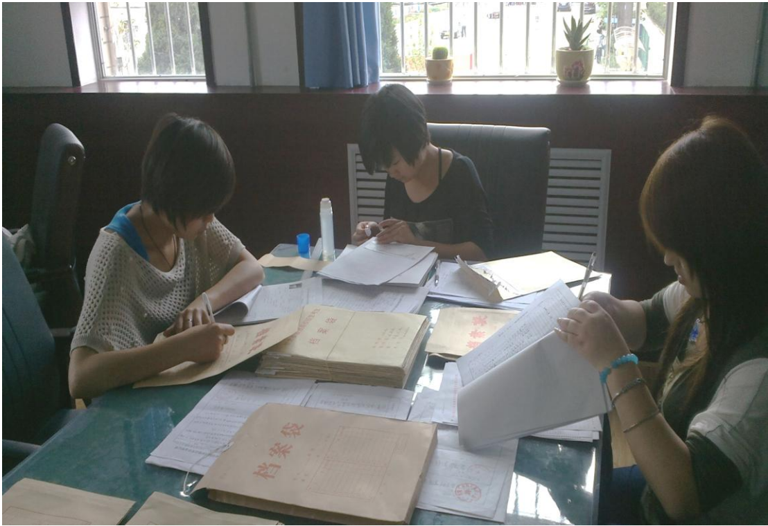
文秘学生在院办公室进行档案整理实训