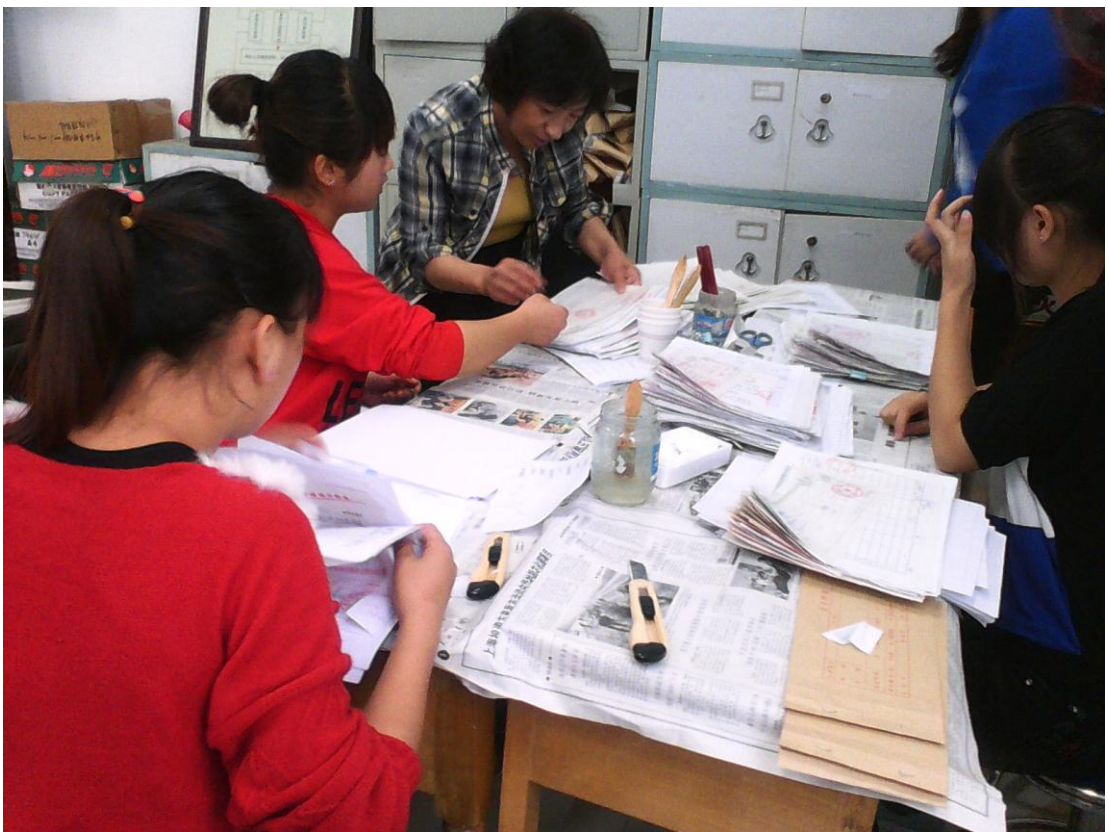
文秘学生在天水市社保局进行档案整理实习