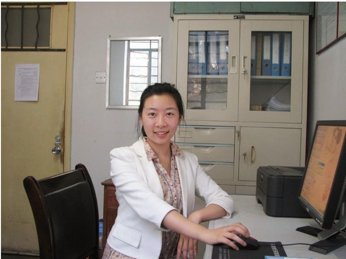
文秘学生在学校各部门进行秘书实务实训