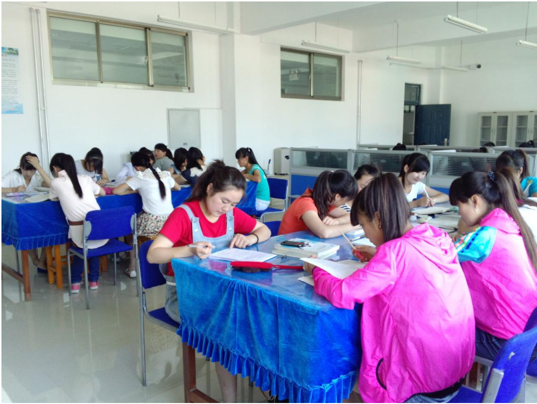
文秘学生在文秘综合实训室进行秘书写作实训