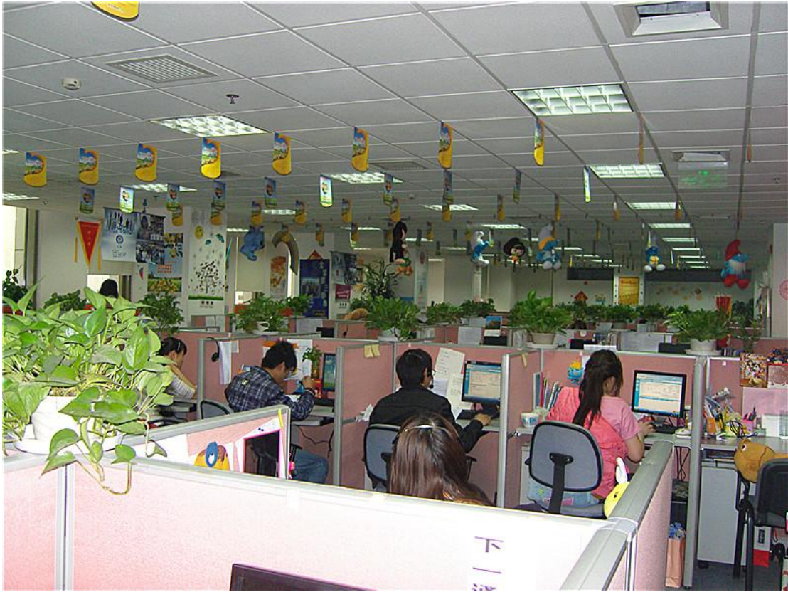
文秘学生在北京阳光集团北区第三电销中心实习