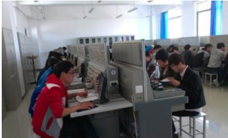
图 7-4 学生上课操作现场

此图是在 PLC 实训室进行“教学做一体化”教学现场，每 2 位学生一组，教师讲授完典型任务的实施环节后，学生进行控制系统安装、接线、调试的情景。