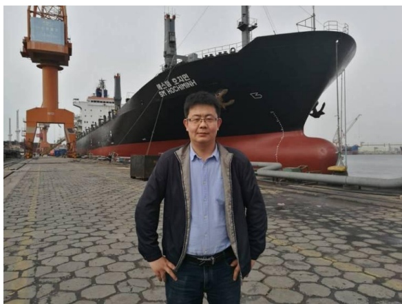
图 4-7 许龙

辛永刚，男，电气 2007 级学生，2010 年毕业生，现在上海同臣环保有限公司工作，电气工程师，目前主要从事环保行业，脱水车间压滤设备的电控设计；对所在公司承接的市政污水处理厂脱水车间的压滤系统进行自动化程序的编写及其触摸屏画面的组态；负责解决公司售后人员现场调试过程中遇到的技术问题；对公司新研发产品，进行电气部分的设计和测试，配合公司技术部门新技术的引进和转化。