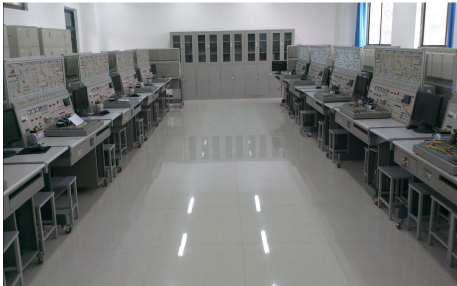
图 7-1 PLC 实训室

PLC 实训室：配有 22 套 THPF5M-1 型可编程控制器（s7-200）实训装置、计算机和投影仪。主要承担 PLC 实验和典型工作任务的一体化教学、PLC 模型演示和课程设计。