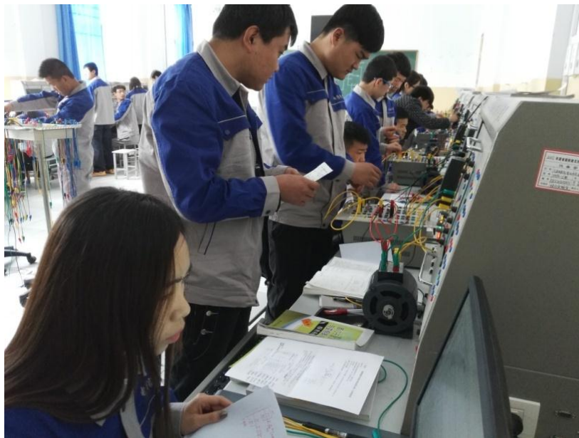
图 7-7 《工业综合控制技术》教学现场

此图是学生在天水长控厂进行企业认知实习的情景，现场是企业技术人员对学生关于高压电气设备的型号、用法及接线的讲解。