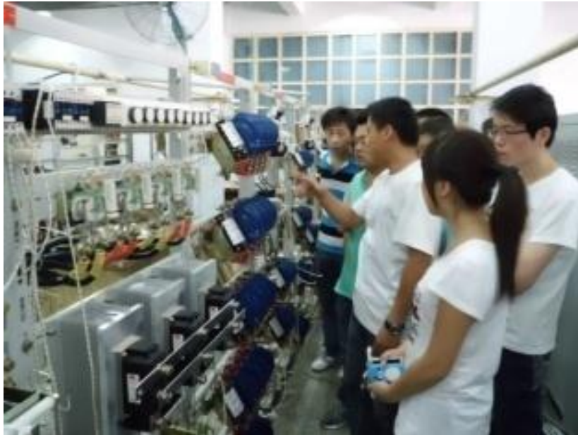
图 7-6 天水长控有限责任公司实习

此图是学生在天水长控厂进行企业认知实习的情景，现场是企业技术人员对学生关于高压电气设备的型号、用法及接线的讲解。