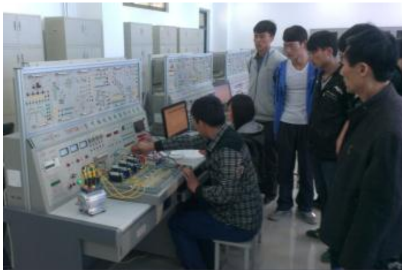
图 7-5 实践教学现场教师指导

此图是在 PLC 实训室进行“教学做一体化”教学现场，每 2 位学生一组，教师讲授完典型任务的实施环节后，学生进行控制系统安装、接线、调试的情景。