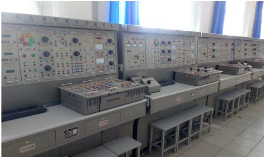
图 7-3 电机与电气控制实验室

自动化综合实训室：配有 12 套 THPK-2 型自动化综合装置，实训项目有电气控制技术、可编程控制器、变频调速控制、直流调速技术、触摸屏和工控组态软件实训。