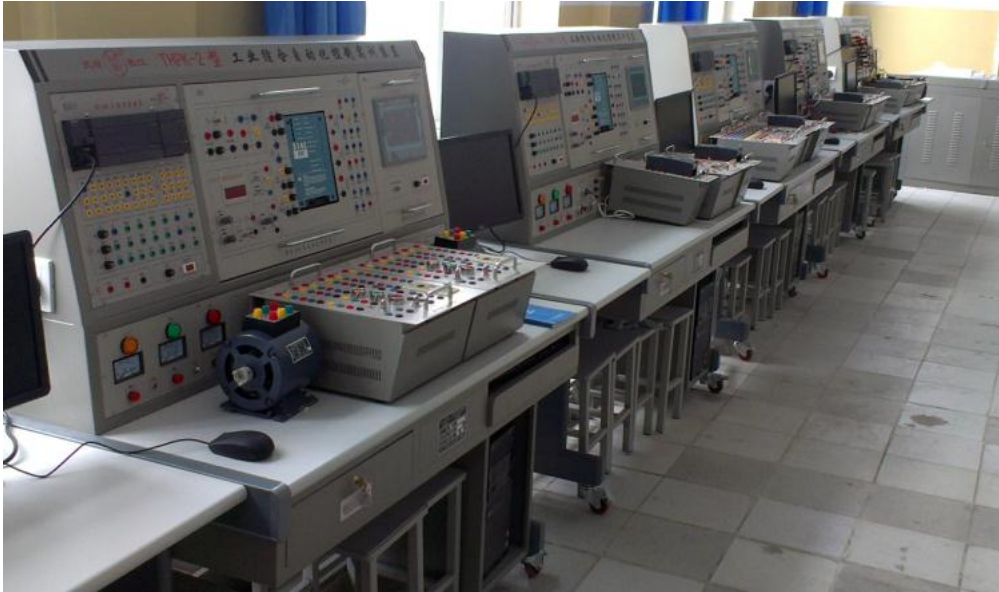
图 7-2 自动化综合控制实训室

自动化综合实训室：配有 12 套 THPK-2 型自动化综合装置，实训项目有电气控制技术、可编程控制器、变频调速控制、直流调速技术、触摸屏和工控组态软件实训。